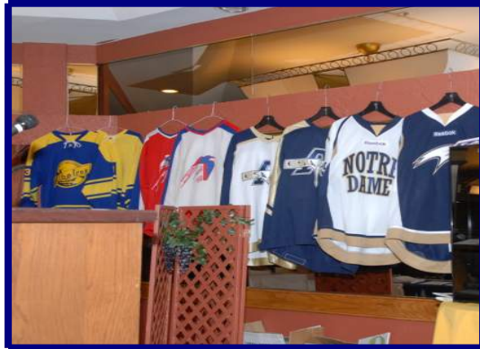
LES DIFFÉRENTS GILETS PORTÉS AUX COURS DES ANNÉES.

Dès sa première saison à la fin des années 1960 et malgré quelques périodes transitoires sans activités, le club de hockey Les Albatros s'est révélé un ambassadeur de Rivière-du-Loup, tant dans la ligue Junior B du Bas-Saint-Laurent et dans le circuit Collégial AA de l'Est du Québec que dans l'actuelle ligue de développement Midget AAA du Québec.