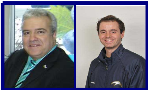
Co-présidents des Albatros du Collège Notre-Dame.